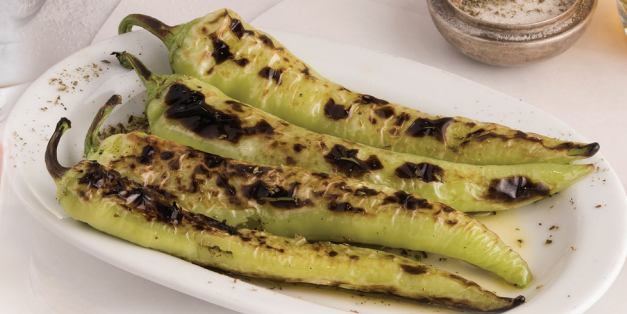
SPICY CHILLI PEPPERS